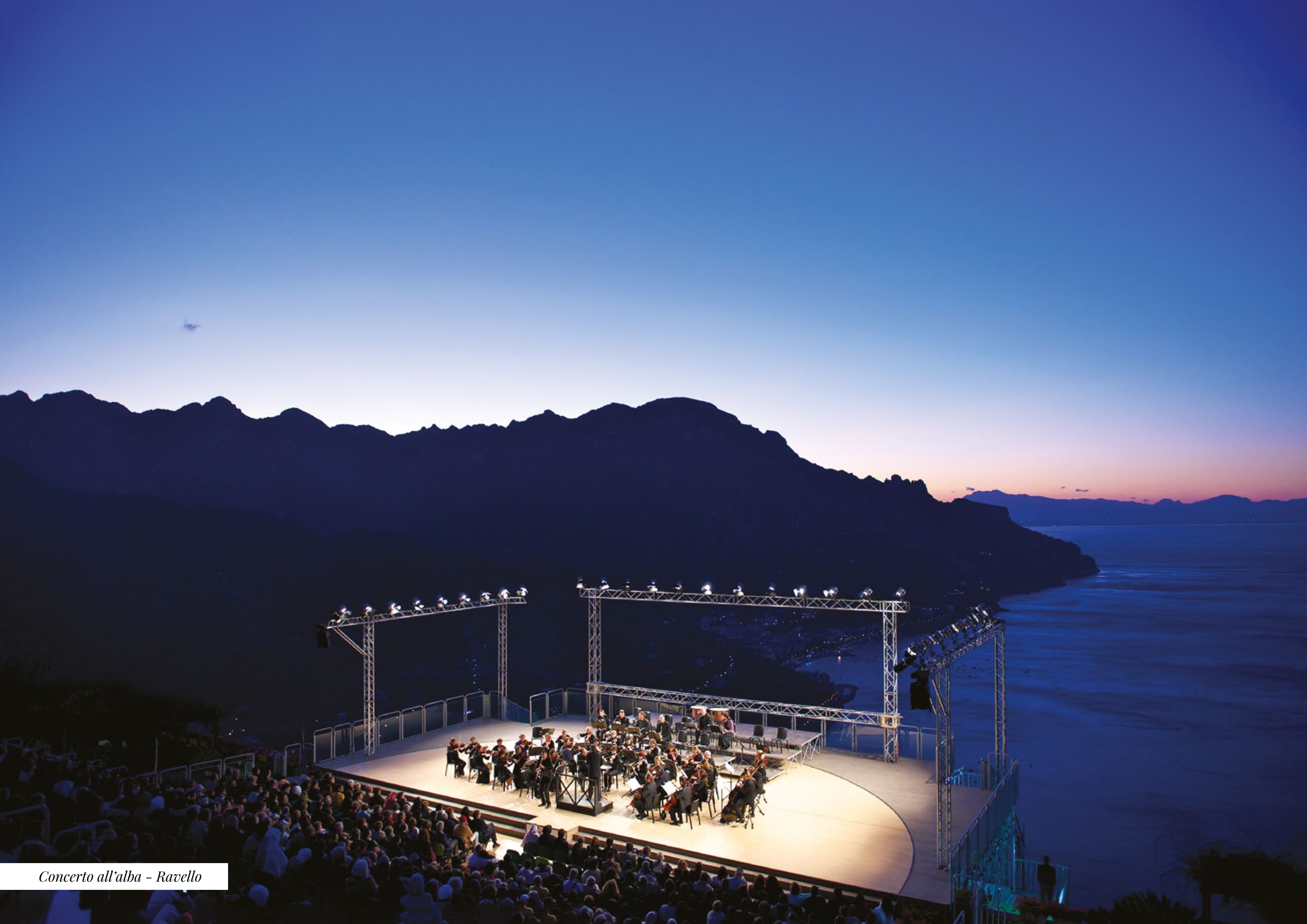
Concerto all'alba - Ravello